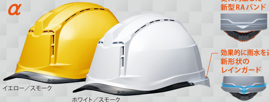
イエロー/スモーク