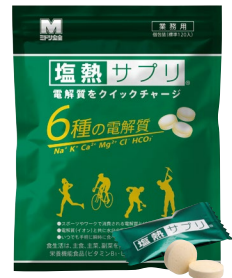
業務用個包装 168g (120 粒入)

塩熱飴® シリーズは 1 粒 + コップ 1 杯 100 ml のお水と一緒にどうぞ。