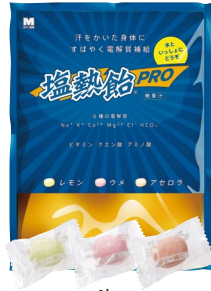
1kg (約 185 粒入)